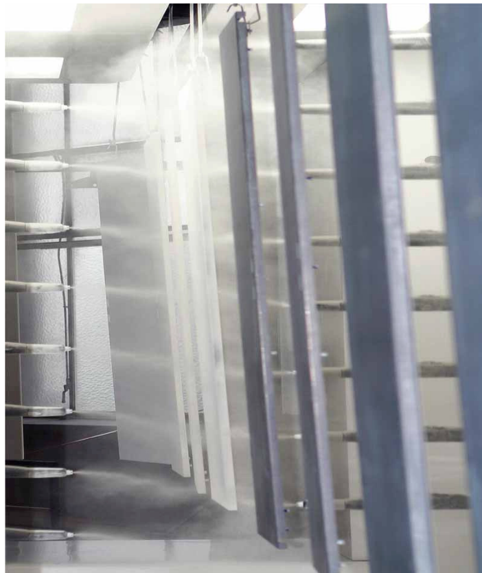
Bild: Blick in die automatische LOHMEIER Beschichtungsanlage

Vlotho – Der Schaltschrankhersteller und Systemanbieter LOHMEIER führt als bisher nicht vermarktete Dienstleistung das Beschichten von Oberflächen auf einer automatischen, höchst effizienten Pulverbeschichtungsanlage aus. Geometrien mit maximalen Abmessungen von 1.200 x 2.200 x 800 mm und bis ca. 100 kg Bauteilgewicht werden mit einer bewährten Epoxy-Polyester-Pulverbeschichtung versehen, die zuverlässigen Korrosionsschutz bietet und wetterfest, kratzfest sowie mechanisch höchst belastbar ist. Die Oberflächen können glatt oder strukturiert ausgeführt werden. Für die Beschichtung ist eine große Auswahl an RAL- oder NCS-Farbtönen verfügbar.